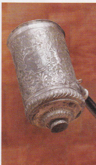
Ziedojuma trauks ar vara grebumiem.

Arī luterāņu dievnāmā ir bikts jeb grēksūdzes sols (altāra kreisajā pusē). Virs tā eņģelis tur spoguļi, tas ir simbolisks aicinājums ieskatīties savā dvēselē un izsūdzēt grēkus.