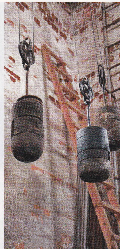
Torņa pulksteņa atsvari.