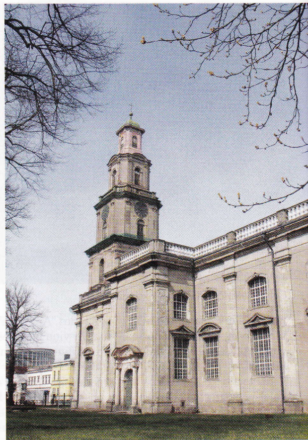
Katedrāles daudzpakāpju tornis (augstums līdz krusta smailei – 55 m) ir ne vien akcents Liepājas panorāmā, bet iekšpusē arī senatnīga telpa ar mehāniskā pulksteņa sirdspukstiem un zvanu skaņām.

Liieldienas ir ne tikai pavasara zīme, bet atgādinājums par garīgo vertikāli mūsu dzīvē. To apliecina arī Liepājas Svētās Trīsvienības katedrāle. Šī luterāņu baznīca uzskatāma par greznāko un monumentālāko ēku Liepājā. Šogad Liepājas Svētās Trīsvienības baznīcas atjaunošanas fondam aprit desmit gadu, paveikti daudzi svarīgi darbi. Ieskatīsimies šajā katedrālē un kaut nedaudz iepazīsim tās nenovērtējamus dārgumus.