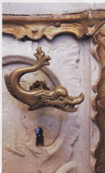
Rokturis delfīna formā.