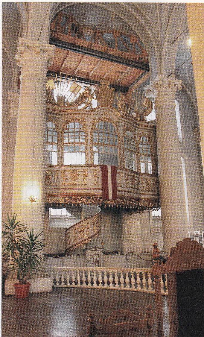
Otrajā stāvā atrodas Kurzemes hercoga loža. Ar autentiskiem slīdlogiem, kuros saglabājušies pat senie vijņainie, rokām darinātie stikli.